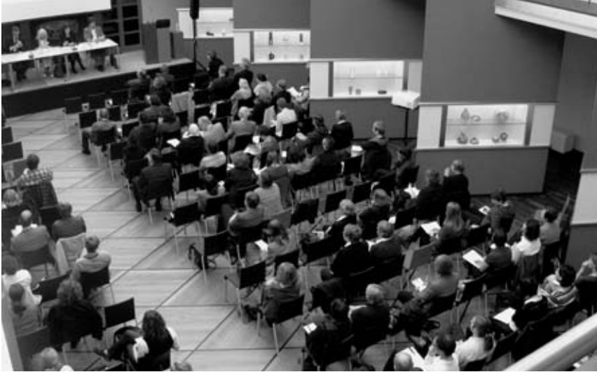
Herbst 2010: Jahrestagung von ICOM Deutschland in Leipzig.