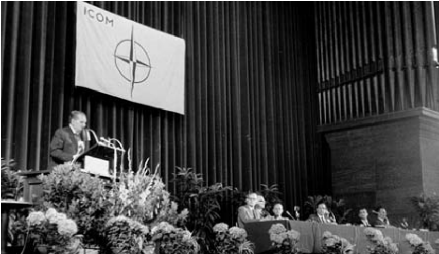
Sommer 1968: In Köln und München fand die 8. Generalkonferenz von ICOM statt.